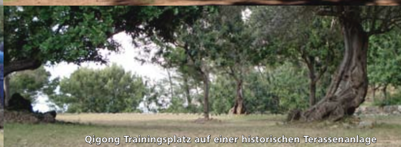
Qigong Trainingsplatz auf einer historischen Terrassenanlage