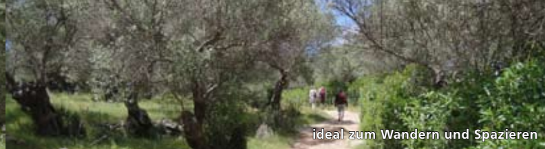
ideal zum Wandern und Spazieren