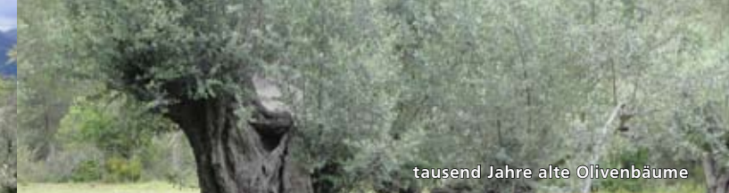
tausend Jahre alte Olivenbäume