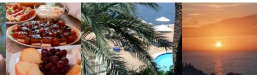
Hotelanlage Costa Dor in der Nähe von Deià