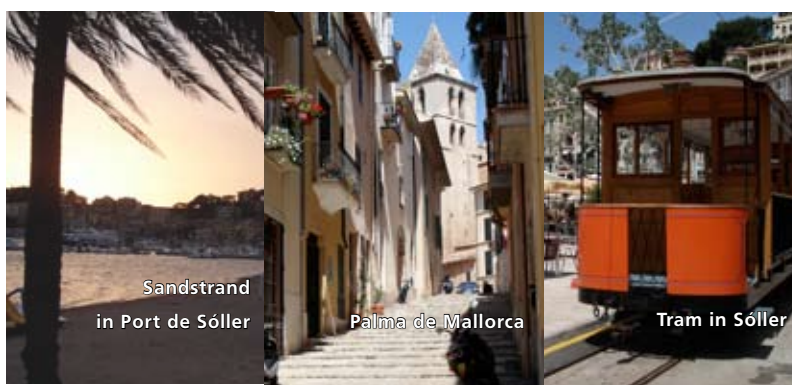
Sandstrand in Port de Sóller