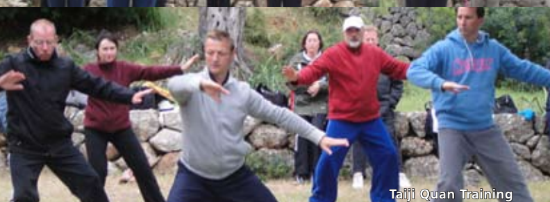
Taiji Quan Training