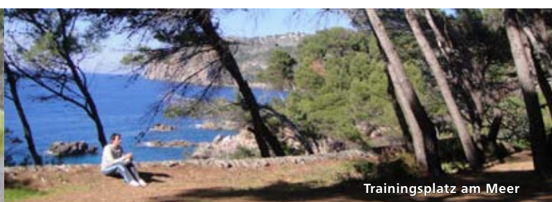
Trainingsplatz am Meer